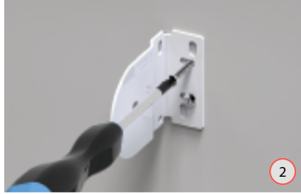
1B - Monteer de steunen aan de wand