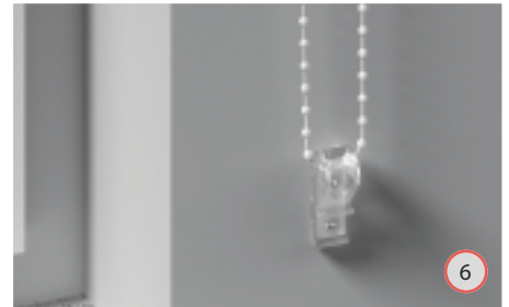
Monteer de kettinghouder - Child Safety