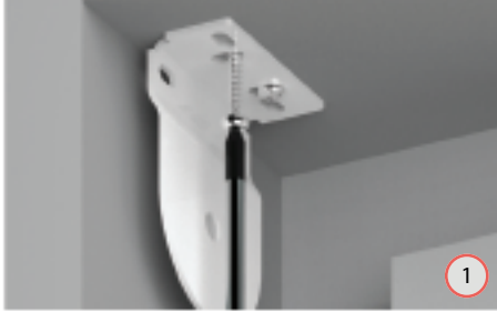
1A - Monteer de steunen aan het plafond