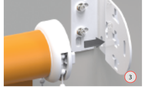
Steek de bedieningszijde van het rolgordijn in het midden van de