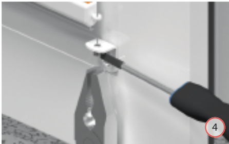
OPTIONEEL - trek het draad op lichte spanning en zet vast