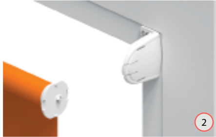
Klik het rolgordijn in de steun