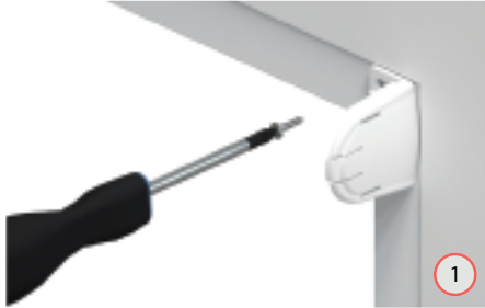
Positioneer de steunen en schroef deze vast